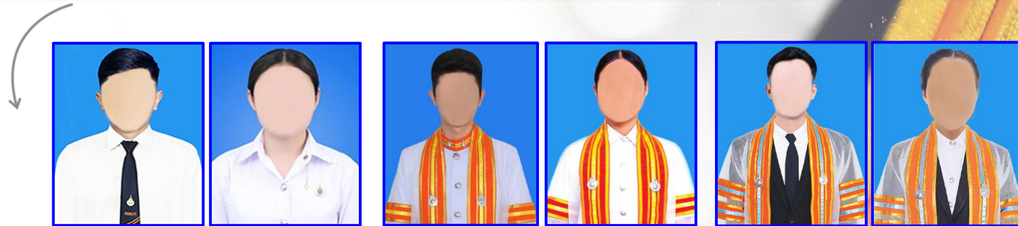
ระดับ ปวส.