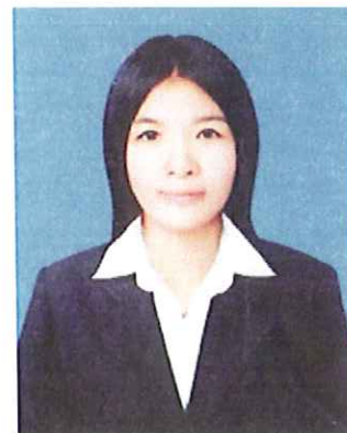
การแต่งกายนักศึกษาหญิง ระดับบัณฑิตศึกษา