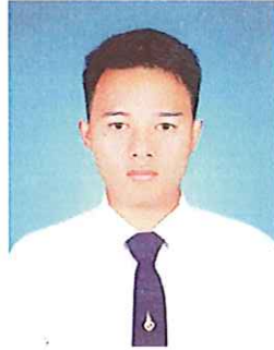
การแต่งกายของนักศึกษาชาย