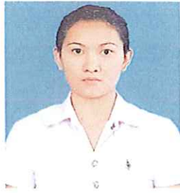
แบบที่ 1 ผมนยาวและรวบผมให้เรียบร้อย