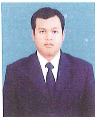
การแต่งกายนักศึกษาชาย ระดับบัณฑิตศึกษา