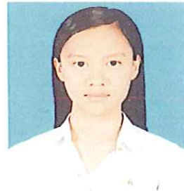
แบบที่ 2 ผมนยาวและปล่อยผมไปด้านหลัง